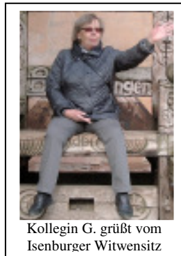
Kollegin G. grüßt vom Isenburger Witwensitz

Postbank Frankfurt, BeW Post PB Telekom IBAN: DE18 5001 0060 0191 9646 03 BIC: PBNKDEFF