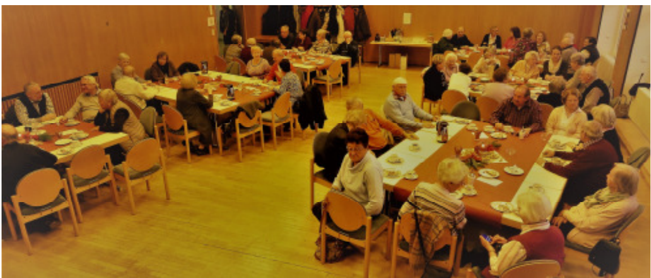
Kuchen und Kaffee/Tee finden letztendlich wieder die notwendige Aufmerksamkeit und das bei reger Unterhaltung.